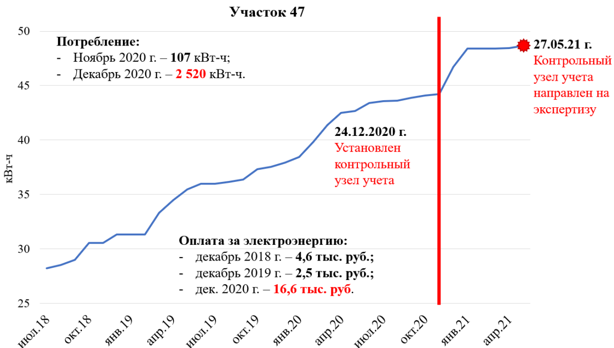
График 1: Изменение электропотребления – участок 47