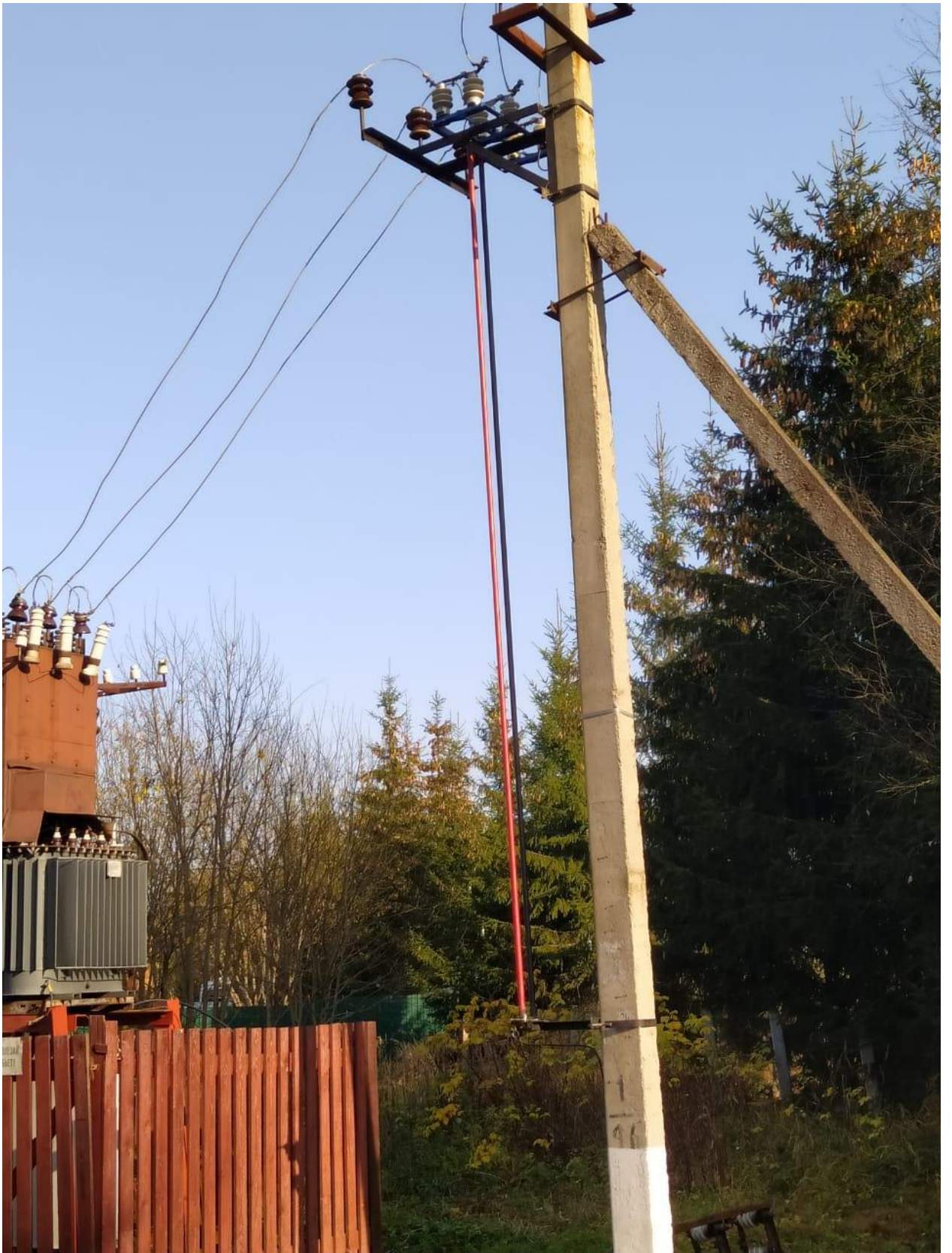
Фото 1: Новый линейный разъединитель в СНТ "Вика", октябрь 2020 г.