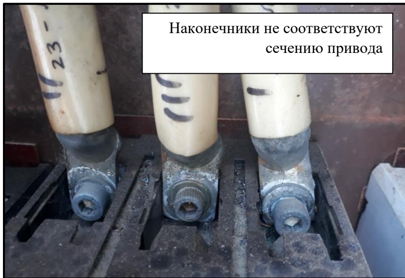
Наконечники не соответствуют сечению привода